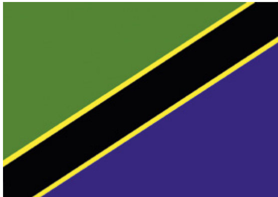
Rys. 1. Flaga Zjednoczonej Republiki Tanzanii

Podobnie jak nazwa kraju, nowa flaga, przyjęta 30 czerwca 1964 roku, jest połączeniem symbolicznych kolorów dwóch głównych części składowych zjednoczonego państwa. Dolny, zielony pas dawnej flagi Tanganiki przybrał błękit flagi Zanzibaru, oba pasy zostały przedzielone ukośnie, aby nadać im równy status. Współczesna flaga Tanzanii składa się z czterech kolorów – zielonego, żółtego, czarnego i niebieskiego. Kolor zielony symbolizuje kraj, niebieski – wodę, żółty – bogactwa mineralne, czarny – kolor skóry Tanzańczyków.